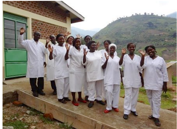
Staben på Mitandiklinikken.

Venner av Uganda har startet et samarbeid med Mitandi for å skaffe de tre nye sykestuene solcelle-strøm, slik at de får lys til behandling etter at mørket siger på, og dessuten kan drive enkle elektriske apparater. Styret i VaU har allerede bevilget kr 5.000 til formålet, men vi er avhengige av bidrag fra medlemmene for å kunne realisere prosjektet. Totalt innsamlingsbehov er kr 24.000 og