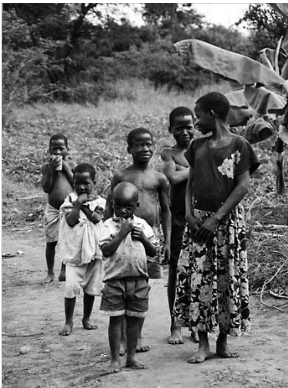
Unge beboere i Kakooge.