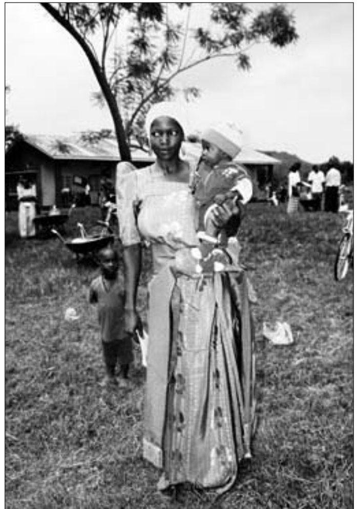
En av de nye RDE's med neste generasjon jordbruker. Kvinner er spesielt i fokus i prosjektet vårt.

NOFU's PC (Project Committee) embraces a multitude