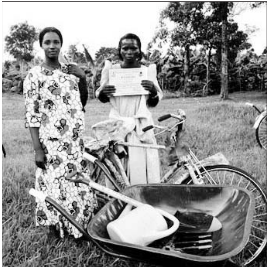
En ny hjelpeinstruktør i Kalagala subcounty har fått sitt diplom for vel gjennomført kurs, pluss utstyr for å klare jobben.