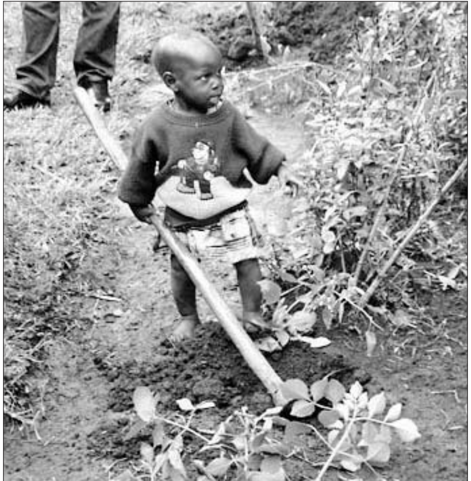
Neste generasjon er klar.

Vi utarbeidet et notat til Norad i juli, der vi skisserte hvordan prosjekt 2b kunne etableres. Vi fikk positiv respons fra Norad på vårt forslag, og etter innstil-