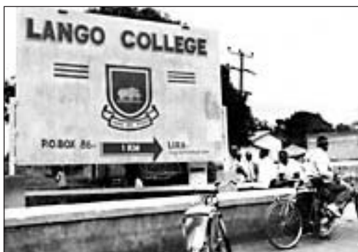
Skiltet ved hovedveien.